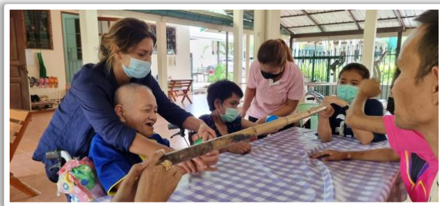
Opa Ta aan het genieten tijdens de activiteiten