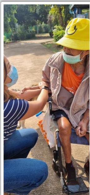
Opa (Ta) Mali