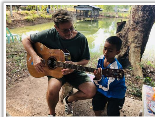
Zomaar een zondag in November

Met een fijn team van huismoeders en vrijwilligers geven we dagelijks Fysio en/of Muziektherapie aan de kinderen. Iedereen draagt zijn steentje bij.